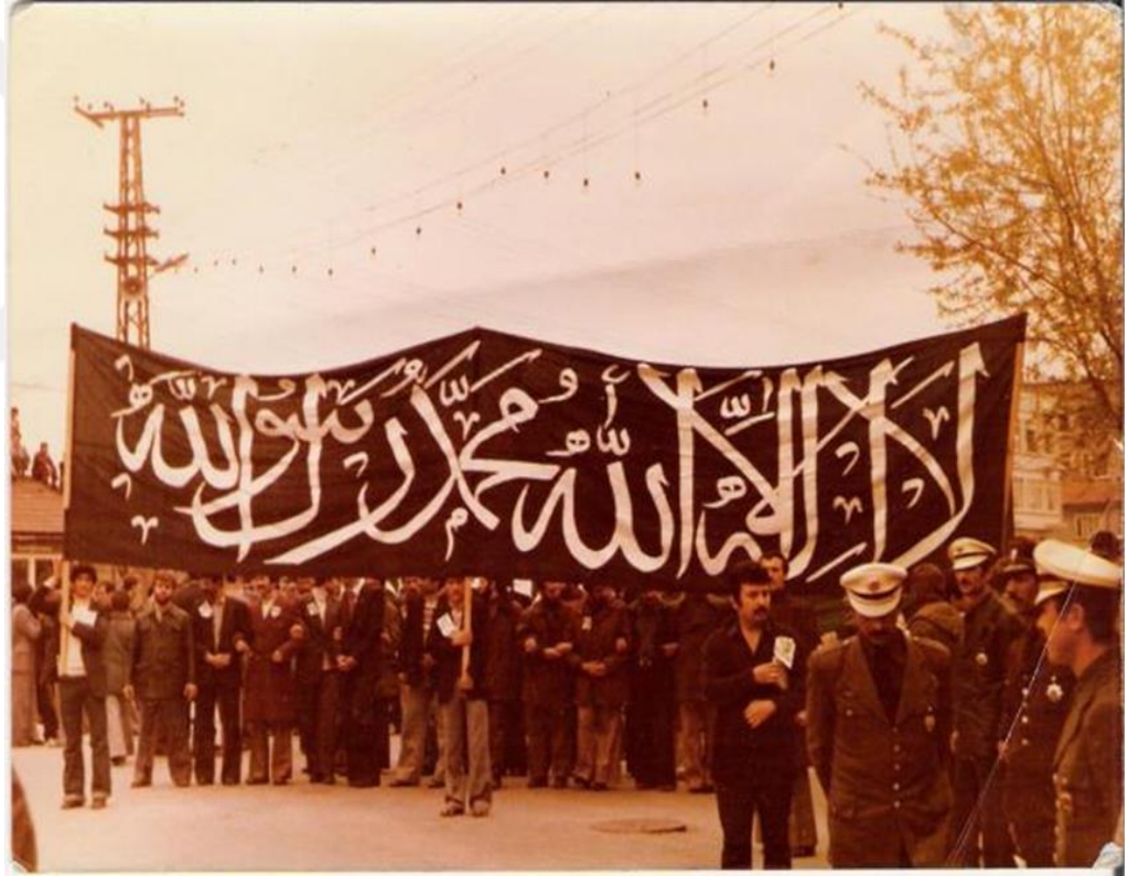
Şekil 4.2.1 Sakarya Mitinginde Açılan Kelime-i Tevhid Dövizi

Sakarya Mitingi ile akıncılar Türkiye'deki İslami uyanışın kendi başına, kendisiyle sınırlı bir uyanış olmadığını dünya İslami uyanışının bir parçası olduğunu göstermek istediler. Nitekim miting boyunca atılan sloganlar bu amaca uygundu. Bir başka amaç ise İslami devletin şimdi ve burada gerçekleşebileceği inancını kamuoyuna duyurmaktı. Miting sırasında "Dün Pakistan, Bugün İran, Sıra Bizde