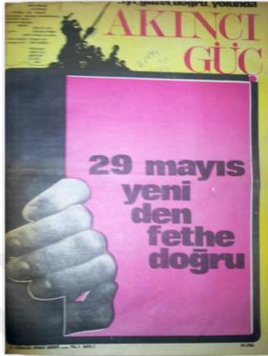
Şekil 4.2.2.1(1) Akıncı Güç Dergisi'nin 1. Sayı kapağı