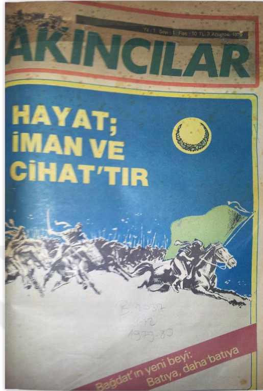
Şekil 4.2.2.1(2) Akıncılar Dergisi'nin 1. Sayı kapağı

Akıncılar dergisinin Akıncı Güç benzeri bir siyasi program önerisiyle yola çıkmadığı açıktı. Teşkilata dönük yazılar neyin yapılacağından çok neyin yapılmayacağı üzerinde duruyordu. Buna göre Teşkilat henüz tebliğ aşamasındaydı ve tebliğ aşamasında siyasi şiddete başvurulmamalıydı: