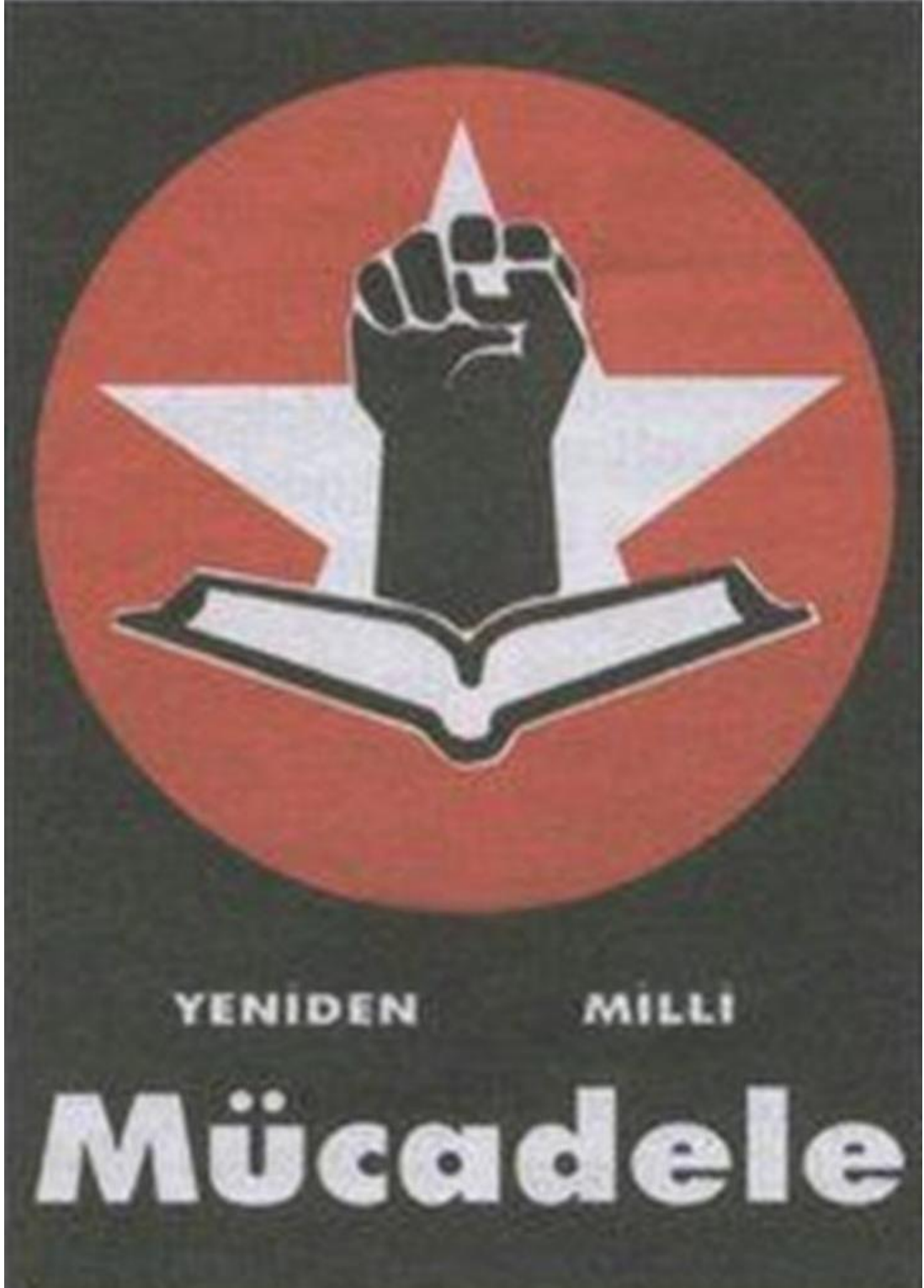
Ek - 1 Yeniden Milli Mücadele Hareketi'nin Amblemi