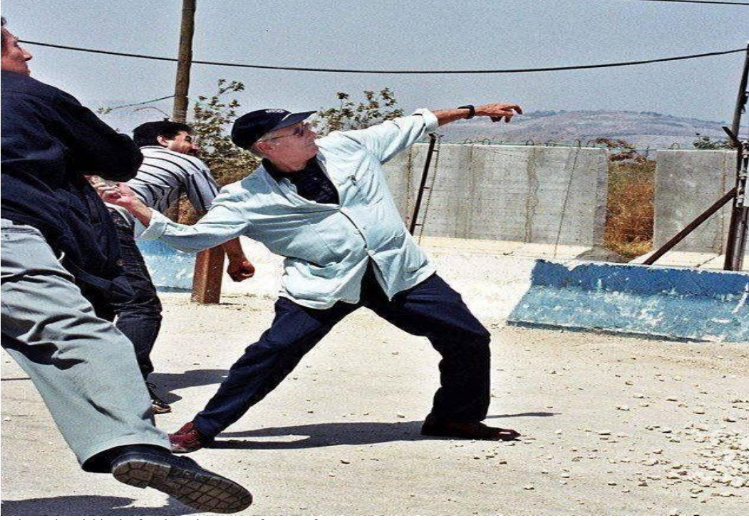
Edward Said'in hafızalara kazınan fotoğrafı.

gerekse diđer konuya taraf olabilecek ülkelerde İsrail karşıtı politik atmosfer zayıf kalmıř, bu alandaki tepkiler spontane ve bağımsız nitelikte kalmıřlardır.