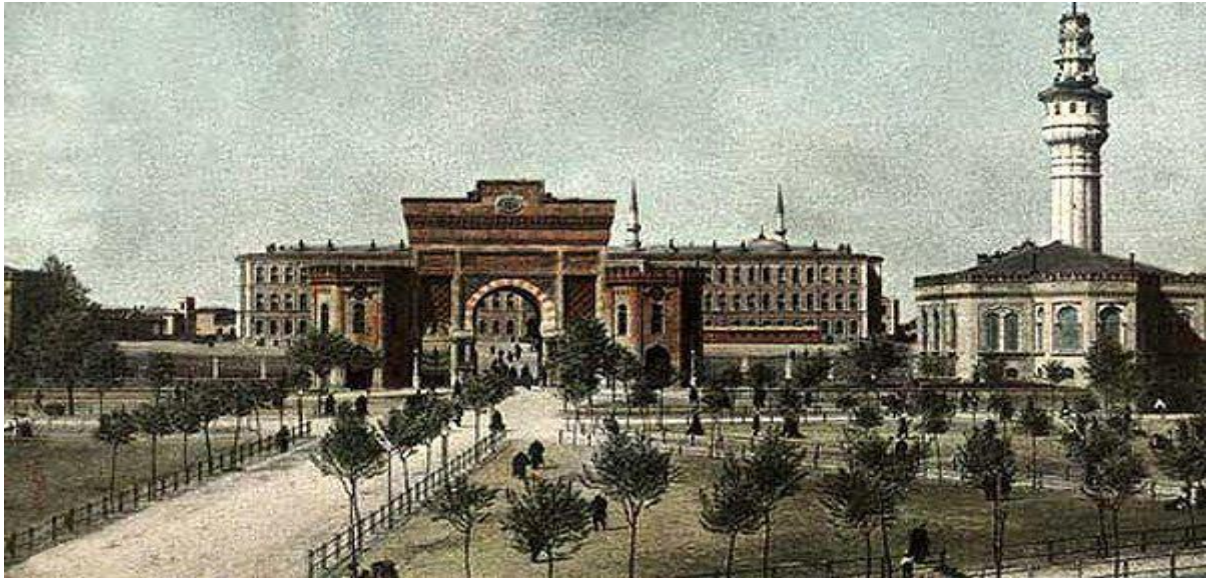
Bayezid Meydanı'ndaki Dârülfünun-i Osmanî Binası (1909)

Dârülfünûn, muhtariyeti (otonomiyi, özerkliği) haizdi. Bu ise, Cumhuriyetten sonra idareyi ele alan Tek Parti hükümetini rahatsız ediyordu. Cumhuriyet ilan edildiğinde, “siyasî cereyanlardan uzak durmak gerekçesiyle” tebrik telgrafı çekmemesi ve 1928 Harf İnkılâbı ’na sıcak bakmaması sebebiyle Dârülfünûn mimlenmişti. 1932 senesinde tertiplenen Tarih Kongresi’nde, Gazi’nin ortaya attığı ve dünya dillerinin tümünün Türkçe’den geldiğine dair Güneş-Dil Teorisi ’ne, Dârülfünûn’dan iki tanınmış edebiyat ve tarih profesörü Mehmed Ali Aynî ile Zeki Velidi Togan açıkça karşı çıkmak gafletinde bulundu. Diğer hocalar da ima yoluyla muhalefet ettiler. Bu, bardağı taşıran son damla oldu. Dârülfünûn’un ölüm fermanı o gün imzalandı.