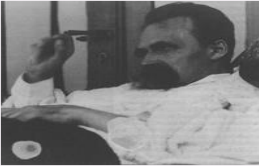
Ocak 1889'da Nietzsche Turin Akıl Hastahanesi'nde.

Hitler 'e ilham veren bilim adamlarından biri hatta en önemlisi de; bugün felsefenin dahisi olarak görülen Friedrich Nietzsche 'dir. Hayatı boyunca akıl hastalığının pençesinden kurtulamamış; sonunda da delirerek ölmüş Nietzsche 'nin marazi-şeytani hayallerinin bu derece kutsanması, anlamlı ve ilginçtir. " Ecce Homo " adlı kitabında; insan-üstü güçlerin(elbette cin-şeytanların) cisimlenerek kendisine vahyettiğini söyler. Bu güçlerin, aynı zamanda kendisini kontrol altına alarak; " Böyle Buyurdu Zerdüş " adlı kitabı yazdırdıklarını itiraf eder. Daha sonra da büyük bir bunalıma girerek hastaneye yattığını anlatır.