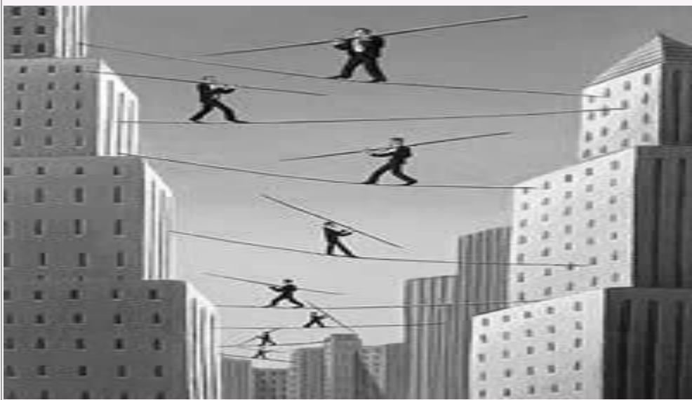
Nietzsche'nin "üst-insan"ına doğru ilerleyen "geçiş-insanları".

Şimdi Nietzsche 'nin, " üst-insan "ına, ya da posthuman ya da kendi dilinde " über-mensch "ine(üst-insanına) daha yakından bakalım. Öncelikle Nietzsche yani ona vahyeden Zerdüşt , insanın mevcut durumundan hoşnut değildir: