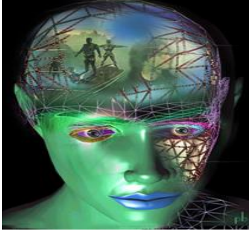
Transhümanistlerin robot-insan hayali!

Transhumanizm , bilim ve teknolojiyi, insan limitlerini aşma yönünde analiz eden ve bu amaçla kullanmayı hedefleyen düşünce akımıdır. Bu kavram, genellikle " insanoğlunun iyileştirilmesi " ile eş anlamlı olarak kullanılmaktadır. Transhumanizm , aynı zamanda bilim ve teknolojiyi, insanoğlunun arzu edilmeyen sakatlık, acı çekme, hastalık, yaşlanma ve istenmeyen ölüm gibi bir takım hallerinin üstesinden gelebilmek için de değerlendirir. Sembolü; ">H veya H+" dır.