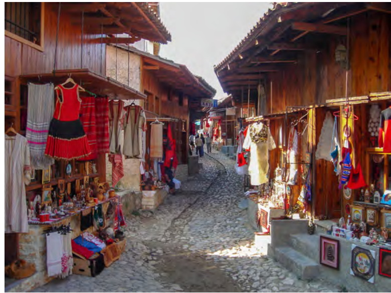
▲ İškodra - Arnavutluk