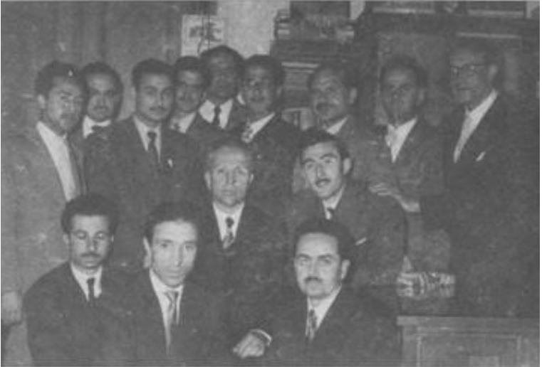
Arkadaşları ve Öğrencileriyle