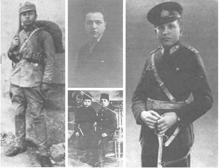
Gençlik ve Askerlik Fotoğrafları