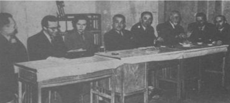
Türk Milliyetçiler Derneği Toplantısında (sol başta) 1 Nisan 1952