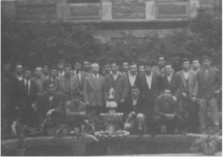
Vefa ve İstanbul Liseleri'nde Öğretmenlik Yılları