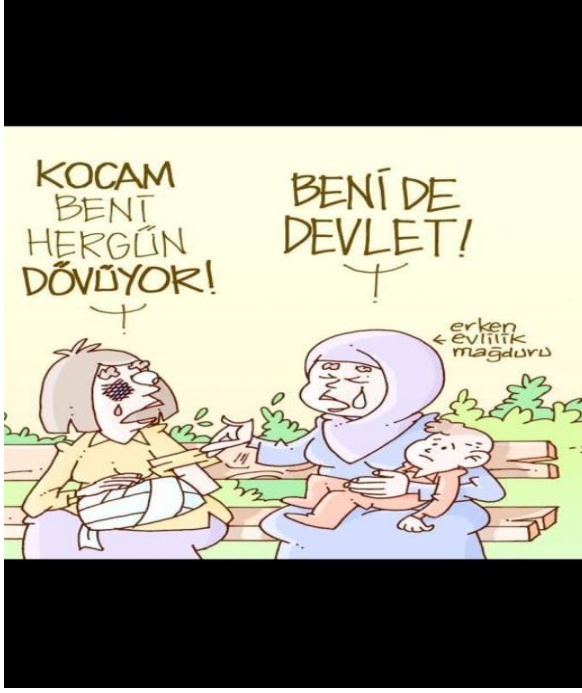
6284 sayılı Kanun