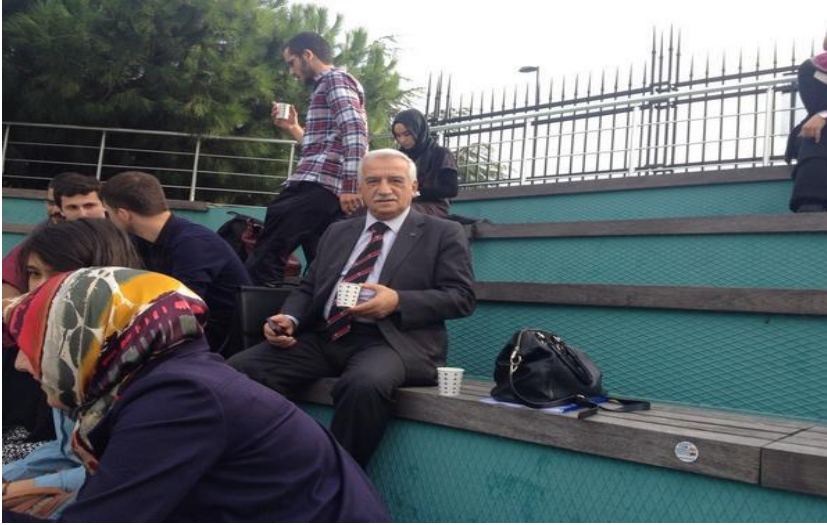
Şehir Üniversitesi Öğrenci Boykotunda

1952 İstanbul doğumluyum. İstanbul Hukuk Fakültesi 1972 giriş, 1977 çıkışlıyım. 1979'dan 2016'ya kadar fiilen serbest avukatlık yaptım. 100 defa dünyaya gelsem yine avukatlık yapmayı isterim. 2016'dan itibaren neredeyse 50 yıla yaklaşan asıl işime, Genç Hukukçularla hukuk çalışmalarına, hukuk derslerine devam ediyorum. İstanbul, Ankara, Adana, Gaziantep, Kayseri, Bursa ve Trabzon'da Genç Hukukçular Hukuk Okumaları Grubu derslerine yardımcı oluyorum. Bu derslerde yapılan sunumların makaleye dönüştürülenlerinin editörlüğünü yaparak BİRİKİMLER adıyla (2020'de 6.sı yayınlanacak) yayınlıyorum. İslam dünyasının önemli sorunları hakkında da hukuk çalışmaları yapıyor ve yapılanlara katkı sağlamaya çalışıyorum. Öğrencilerin haklı taleplerine de destek olmaya çalışıyorum. Bu kapsamda yakın dostlarımla birlikte kurduğumuz HUKUK VAKFI'nın başkanlığını da yürütüyorum.